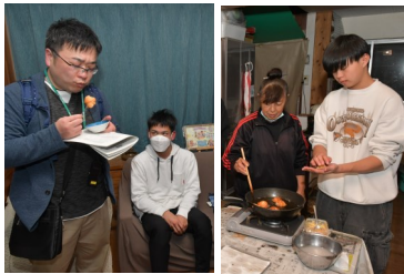
定番のサーターアングギー作り