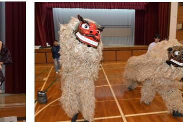
獅子舞演舞 (小学生！)