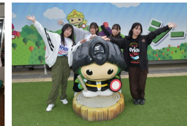
シークワサーパークにて