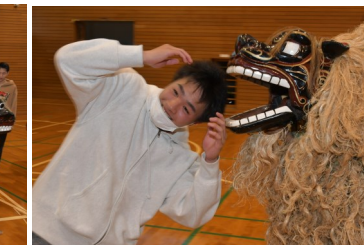
これで1年間健康で幸せに!?