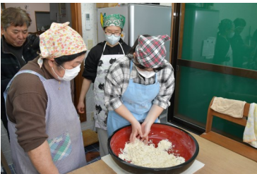
沖縄そばの麺作り体験