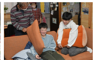
自宅でくつろぐかのような…