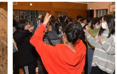
フィナーレのカチャーシー