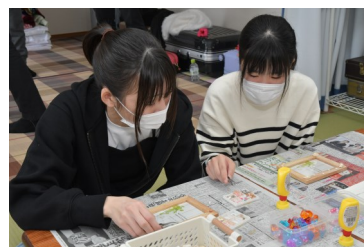
貝殻装飾の写真フレーム作り