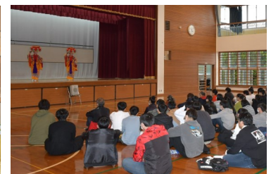
【交流会】琉球舞踊：四つ竹