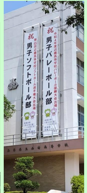
▲校舎本館の懸垂幕 (懸垂幕はイオン山崎店にも掲出) ◀山崎・夢公園の横断幕