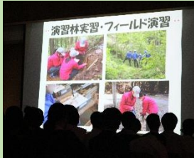
▲事業報告・事業計画案報告の様子