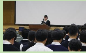
▲模範発表(意見発表)