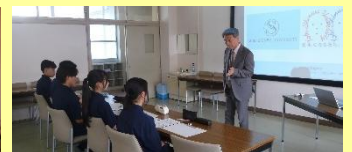
▲あなたの夢は何ですか？