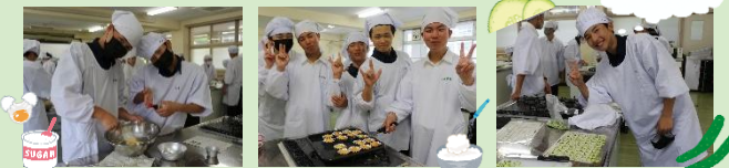
▲グループに分かれてカップケーキ作り ▲きゅうりの半月切り

5月21日(木)5・6限、男子は調理室にてカップケーキ作りときゅうりの半月切りにチャレンジしました。高校で初めての調理実習で、焼きあがったカップケーキは、感謝の気持ちを込めて家族にプレゼントしました。きゅうりの半月切りでは苦戦している生徒も数名いましたが、30秒間で81枚切れている生徒もいました！これを機に調理の楽しさを感じ、食への興味をさらに深めてもらえたらと思います！