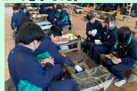
▲皆で協力して火起こし

4月14日(火)に81回生が、「神之河のひととき」にてオリエンテーション実習を実施しました。団長・施設の方のお話の後、生徒代表は施設の方々へ挨拶を、学年全体に向けては意気込みを話しました。その後は班ごとに分かれてBBQを行い、班長が中心となってみんなで協力して上手に火をおこすことができました。用意していただいた食材を自分たちで焼いて食べお腹一杯になり、生徒たちはとても満足した様子でした。食後は班ごとに「謎解きゲーム」に挑戦しました。最後には、教頭先生のご指導のもと校歌を学年全員で歌いました。今回のオリエンテーション実習では、クラスメートと協力することの大切さを学び、クラスの団結力を強めることができました。