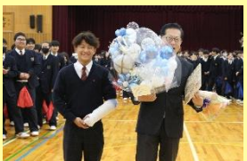
▲野球部・森と食科の生徒が贈り物を手渡しました