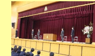
▲生徒代表による感謝の言葉