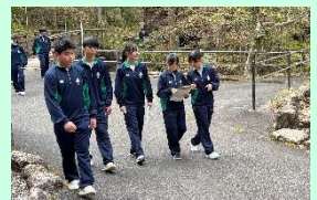
▲謎解きゲームの様子