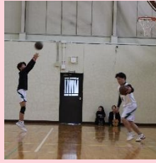
▲男子バスケット部