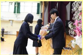
▲生徒会役員が花束贈呈