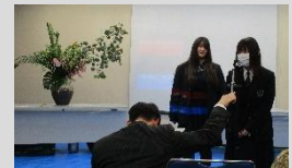
▲花生け演舞に出場