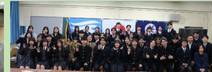
▲最後に全体で集合写真を撮りました