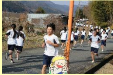
▲一人一人がベストを尽くしました