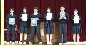
▲1～3位のクラスが 表彰状と盾を受賞しました