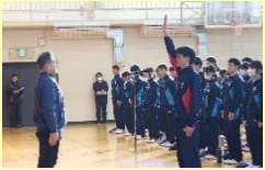
▲体育委員長が代表宣誓