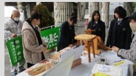
▲森と食科のブース

県内の県立高等学校の生徒たちが、日ごろの探究活動の成果をポスター発表やステージ発表、また職業学科による学習成果の発表、さらには大学教授による講演会やファッションショーなども行われ、各校様々な取り組みが一堂に会して発表されました。本校からは、森と食科の生徒が木工品の販売や製作体験ができるワークショップを行い、華道部の生徒が花生け演舞2025に参加しました。生徒にとっては、とても貴重な体験となりました。