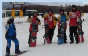
▲スノーボード班も大満喫!!