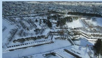
▲雪化粧した五稜郭☆