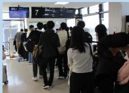
▲いよいよ搭乗です!

<1日目>伊丹空港から函館空港に到着し、五稜郭を見学しました。歴史ある五稜郭は、国の特別史跡に指定されています。雪に覆われた五稜郭の絶景は、生徒たちの心を魅了しました。その後、函館大沼プリンスホテルに到着しました。2日目からは、スキー実習です!