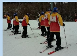
▲いよいよ講習スタート!!

<2日目>朝食後、スキー講習の準備をし、ゲレンデで開講式を行いました。スキーとスノーボードに分かれ、各班のインストラクターの指示に従い、講習を受けました。この日は基礎を中心にしっかりと教わりました。講習の後は、函館山に移動し、函館山ロープウェイに乗り、夜景を見学しました!❖