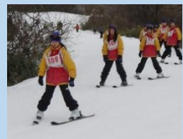
▲皆とても上手です!!

<3日目>この日も午前と午後に分かれて、スキー・スノーボードの講習を受けました。レベル別にそれぞれ合ったコースで滑りました。あっという間の講習会でしたが、北海道の七飯スキー場で貴重な体験をすることができました。夜は、ホテルでアイヌに関する講演を聞き、アイヌの文化に触れました。