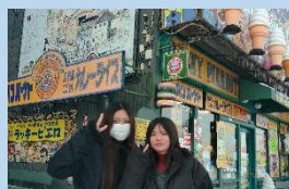
▲ハンバーガーレストラン 「ラッキーピエロ」の前で♪

<4日目>最終日は、荷物をまとめてから、函館研修で『金森赤レンガ倉庫』へ行きました。また、それぞれの班で事前に立てた計画に沿って函館研修を行い、冬の函館を楽しみました。集合時間には、どの班も遅れず集合することができました!