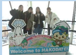
▲函館に着きました!