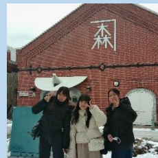
▲赤レンガ倉庫の前で♪「森と食料の森!」