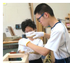
作業学習「さおり」「木工」