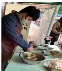
就業体験活動「わとくカフェ」

得意なことやできることを生かしながら、卒業後の就労や自立に必要な力を身に付けるため、様々な体験活動に取り組んでいます。