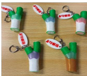
「DX 推進事業」生徒作成製品