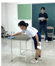
技能検定「物流・品出し」「ビルクリーニング」