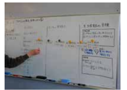
期日までに提出できる方法を考えている