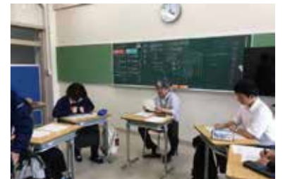
記憶の方法を確認している