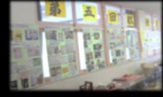
②教材展を一般公開 普通校の先生と一緒に教材について話をする