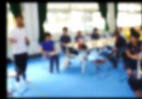
①基礎講座を普通校の先生に公開 普通校の先生と一緒に学ぶ