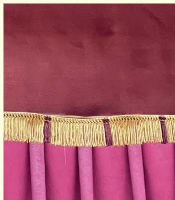
ヒダが外れかけている