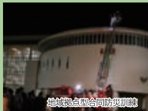
地域拠点型合同防災訓練