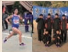
陸上部 駅伝競走 近畿大会出場