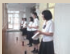
放送部 創作テレビドラマ部門 全国大会出場