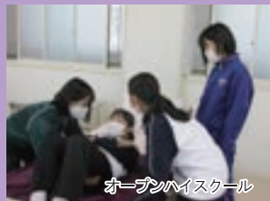
オープンハイスクール