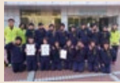
女子バレーボール部 近畿大会出場 ビーチバレー 全国大会出場・近畿 5 位