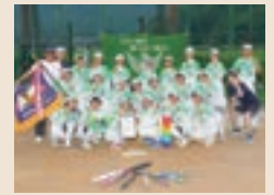
ソフトボール部 西播大会優勝