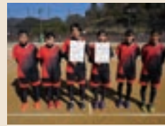
ソフトテニス部 県高校総体 2年連続 近畿大会出場