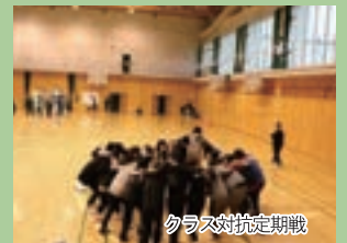
クラス対抗定期戦