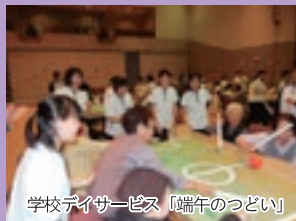
学校デザイナーズ「端午のつどい」