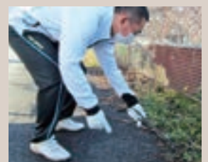
▷全校ボランティア