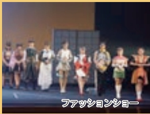
ファッションショー