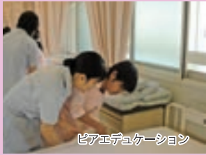
ピアエデュケーション