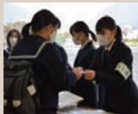
▷オープンハイスクール

球技大会 前期インターンシップ オープンハイスクール 総合デザイン科 青空キャンパス 総合福祉科 介護教室