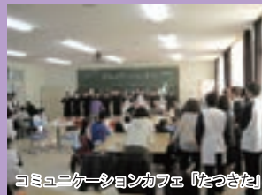
コミュニケーションカフェ「たつぎた」