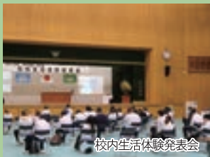
校内生活体験発表会

第1学年科目「簿記」「情報処理」で、商業の基礎・基本を学び、第3学年科目「課題研究」では、より実践的な学習を行い、地域で活躍する人材の育成を目指しています。また、商業分野に関する検定取得が取得でき、専門分野の技能習得・意欲向上を目指します。