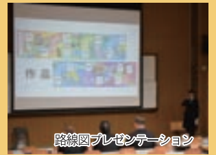
路線図プレゼンテーション