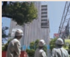
▷インターンシップ