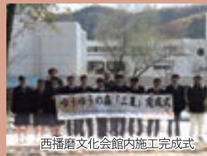
西播磨文化会館内施工完成式