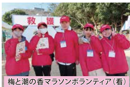
梅と潮の香マラソンボランティア(看)