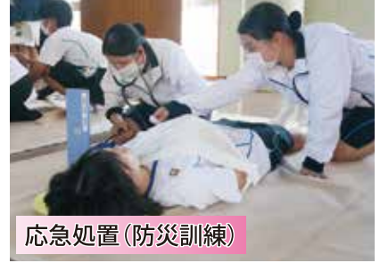
応急処置(防災訓練)

専攻科課程の2年間は、専門性を高め、臨地実習を積み重ねて看護師国家試験合格を目指します。