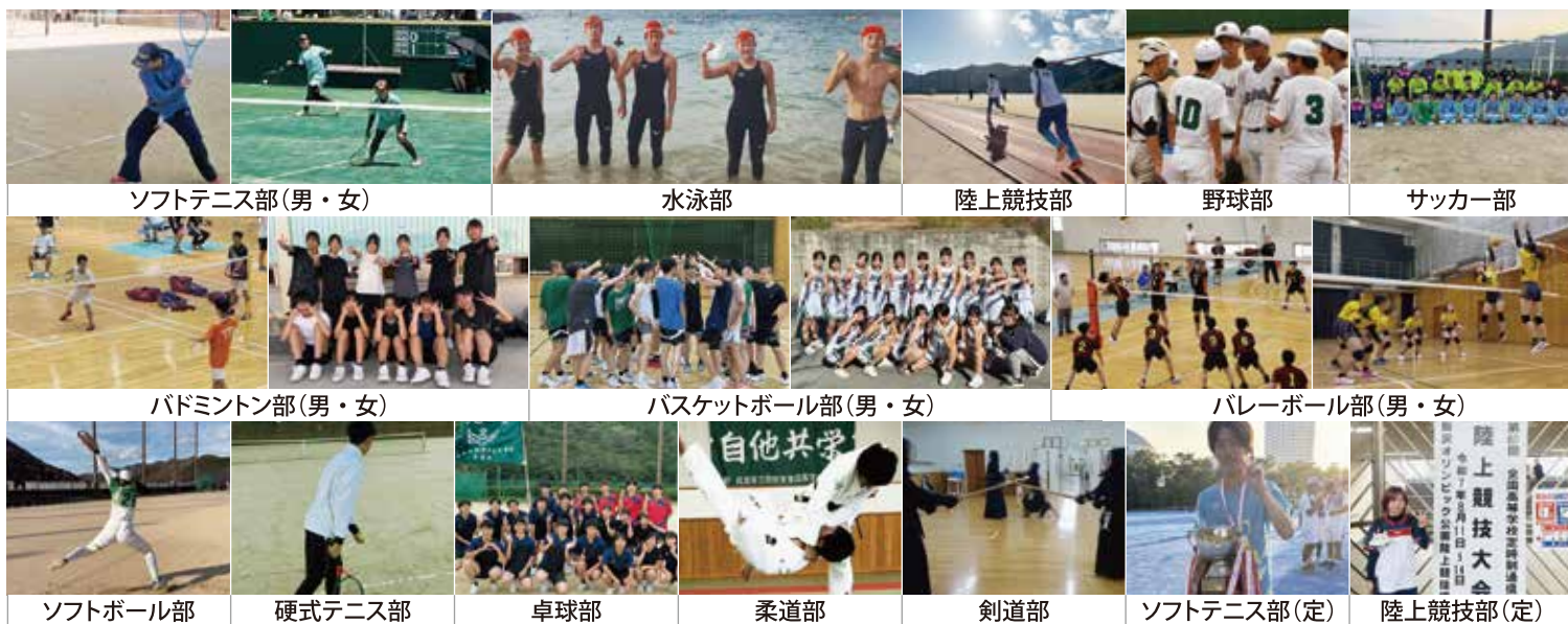
ソフトテニス部(男・女)