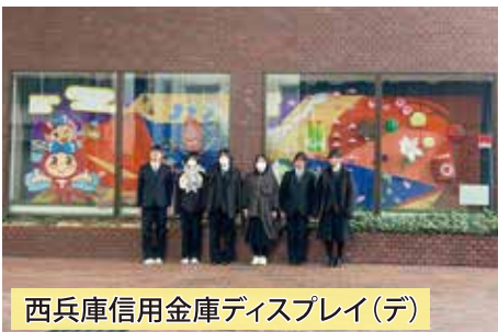
西兵庫信用金庫ディスプレイ(デ)