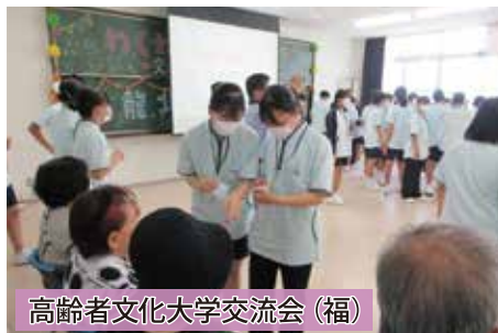
高齢者文化大学交流会(福)