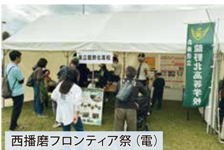
西播磨フロンティア祭(電)