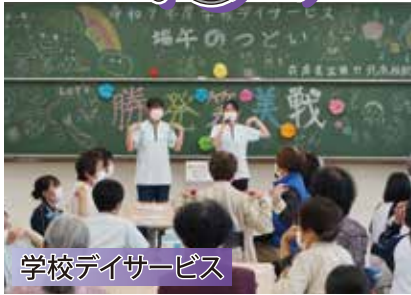
学校デイサービス