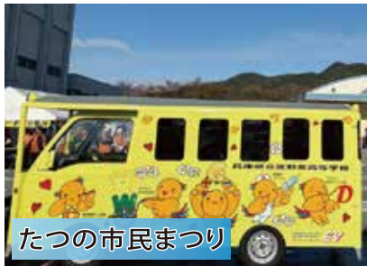
たつの市民まつり

電気に関する基礎・基本を中心に電子や情報の分野まで幅広く学びます。楽しい「ものづくり」から「ひとづくり」に取り組んでいきます。