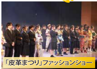
「皮革まつり」ファッションショー