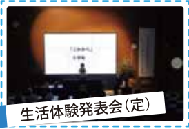
生活体験発表会(定)