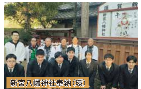
新宮八幡神社奉納(環)