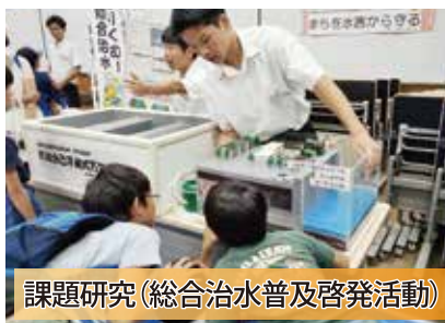
課題研究(総合治水普及啓発活動)

建築物の設計や施工方法を学ぶとともに、快適な住空間を設計するために必要な知識、法律、感性を身につけます。