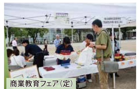
商業教育フェア(定)