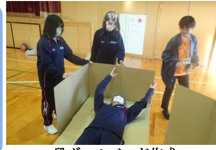
段ボールベッド作成