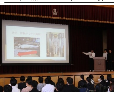
生徒会による学校紹介

生徒会による学校の紹介や、放送部が作成した文化祭(昇龍祭)の動画などを視聴していただきました。また授業も見学していただき、本校の魅力を伝えました。