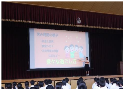
生徒会による学校紹介

8月24日(木)、25日(金)の2日間にわたり、オープン・ハイスクールを開催しました。 1000人以上の中学生や保護者の方が体験授業や部活動見学に参加しました。