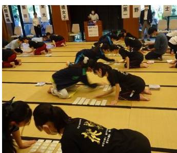
百人一首 全国大会

百人一首部 第45回全国高等学校選手権大会 1回戦 龍野 3-2 安積黎明 2回戦 龍野 0-5 関東第一