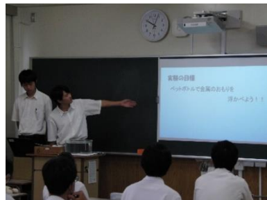
体験授業で講師役を務める本校生徒

8月4日(金)に総合自然科学科体験入学を開催しました。 51名の中学生が参加しました。総合自然科学科の2年生が、学校や総合自然科学科の紹介、体験授業などを行いました。