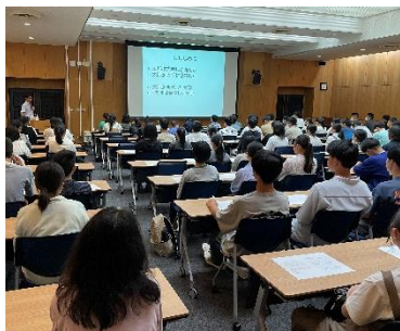
北海道大学での講義

1日目 北海道大学で文系クラスと理系クラスに分かれて講義をしていただきました。その後、東京ドーム38個分の広さをほこる札幌キャンパスを自由散策しました。