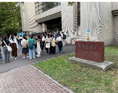
札幌キャンパス散策