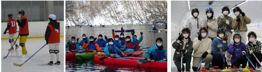
アイスホッケー カヤック(支笏湖) カーリング体験