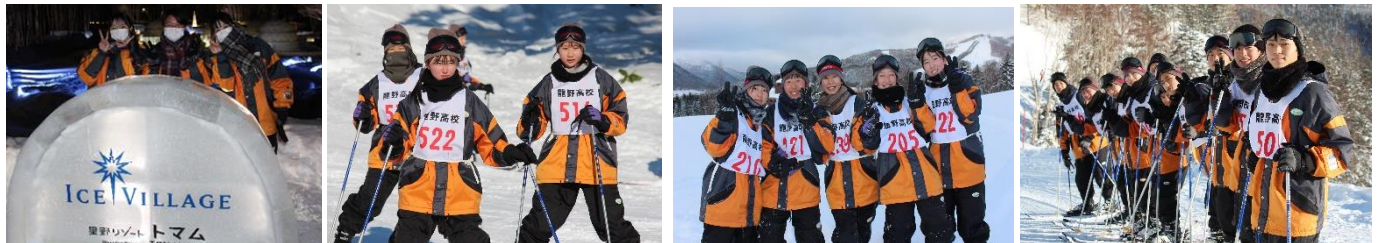
アイスビレッジ スキー実習

午後の講習では、ゴンドラに乗り山頂近くのゲレンデに挑戦した班もありました。また、見学者もゴンドラに乗って霧氷を見学したり、施設でガラス細工の製作をしたりしました。夜は「アイスビレッジ」を見学しました。雪や氷と光、音楽の融合が素晴らしく、雪国トマムならではの氷の世界に生徒たちは興奮冷めやらぬ様子でした。