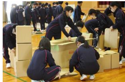
段ボールペット作成

自衛隊の方からは、土嚢づくりや土嚢の積み方、実際の救助現場で使用する道具の使い方を教えていただきました。また、避難所の広さを体験しながら学ぶ避難所開設の講義をしていただきました。消防士の方からは、心肺蘇生法と負傷者搬送法を教えてくださいました。防災士の方からは、ペーパーパーティションや段ボールベッド、災害時トイレの組み立て方や、応急手当の仕方、ロープワークを教わりました。さらに、災害の際に想定される様々なシチュエーションに対して、どのように考え、どのような行動をとるかを意見交換するクロスロードゲームを行っていたいただきました。 講師の先生方の経験に基づいた重みのある言葉や真剣な姿勢から、防災・人命救助への強い思いが伝わり、災害に備えておくことの重要性を再認識する機会となりました。