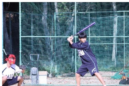
ソフトボール (男子)