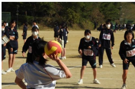
ドッジボール (女子)