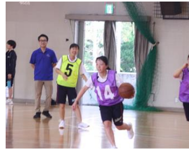
バスケットボール (女子)