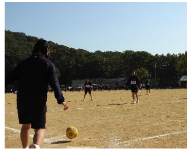
キックベース (女子)

☆158号☆ 県立龍野 高等学校 企画広報部 Tel: (0791) 62-0886