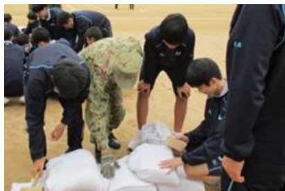
土嚢の積み方指導