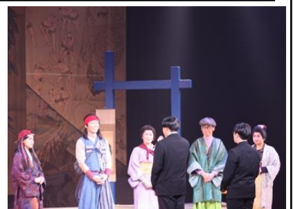
生徒会による謝辞