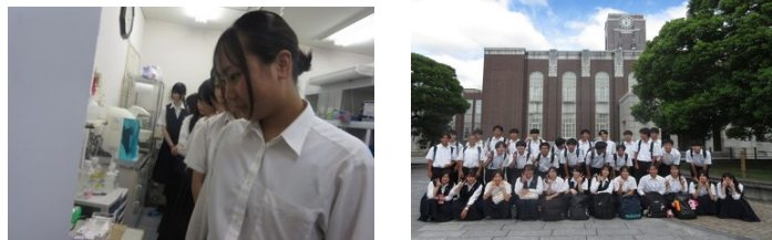
京都大学野生動物研究センター