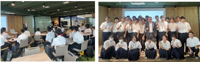
株式会社ダイセル東京本社