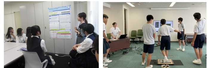
神戸大学人間発達環境学研究所