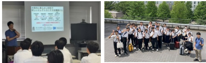
東京大学生産科学研究所