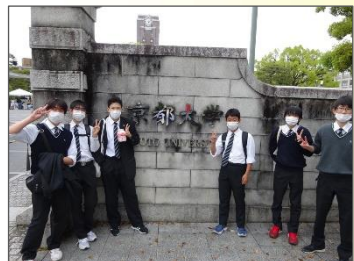
↑ 2年：京都 東山 ← 3年：USJ