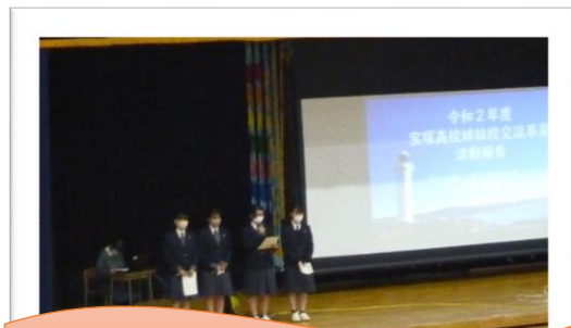
スミスヒル・ハイスクールとの交流♪