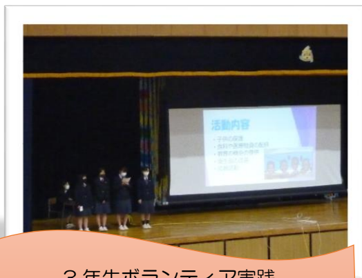
3年生ボランティア実践 テーマは「ユニセフ」