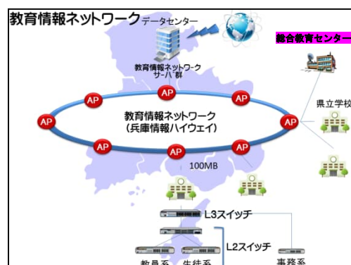
図 1 教育情報ネットワーク概念図