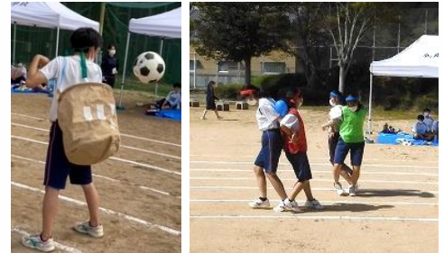
生徒会競技は、盛り上がる種目を生徒会の皆さんが考えてくれました。