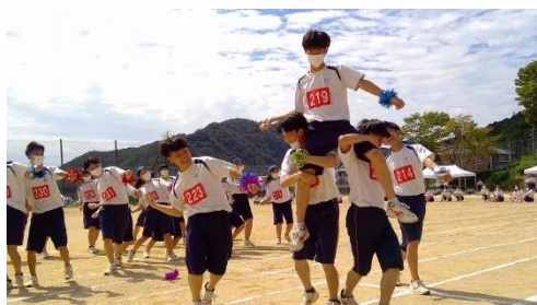
学年演技で弾ける3年生。