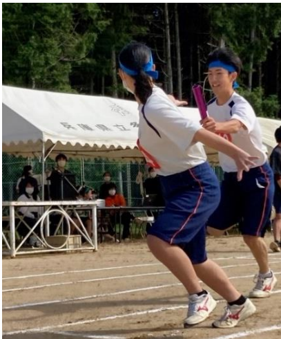
仲間を信じて、バトンパス！

今年度の体育大会は、「狼煙 のろし 」のスローガンのもと、爽やかな秋晴れの中で開催されました。午前中のみとコンパクトな開催となりましたが、3年振りに保護者（3年生のみ）にも観覧していただき、一歩前進した形で行うことができました。