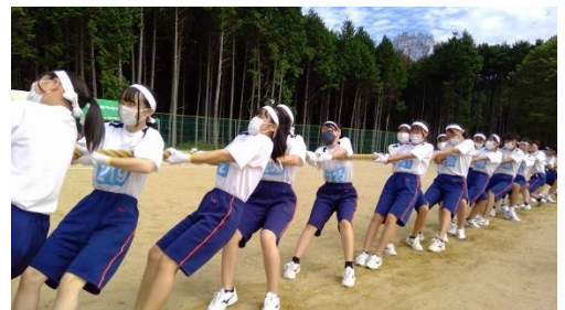
タイミングを合わせて、オーエス！