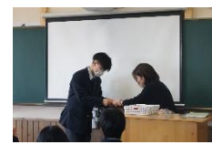
iDEA シール Get!(12/23)