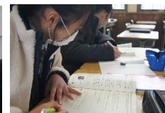
冬季補習お疲れさまでした!(12/26-28)