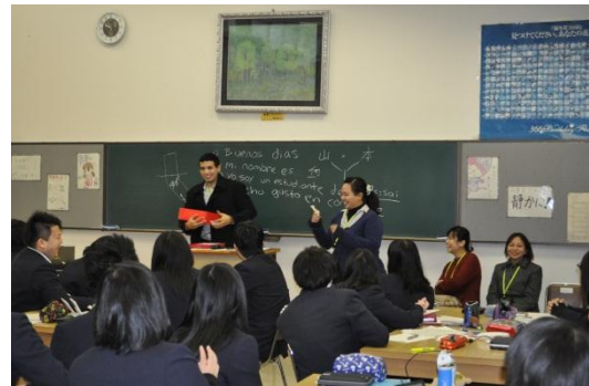
↑ボリビアについて。先生のお話が興味深く、クイズに答えてプレゼントも頂きました。

続けて各グループに分かれ、本校生徒が事前に調べた各国のことについて質問し、意見交換を行いました。1 グループにつき生徒5名、講師の先生に 10 分ごとに順番に移動してもらいます。少人数でいろんな先生に触れ合うことが出来たので、生徒也大満足です。