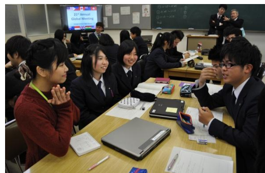
↑マレーシア出身の先生は私達の英語を優しくしっかりと聞き取ってくださいました。