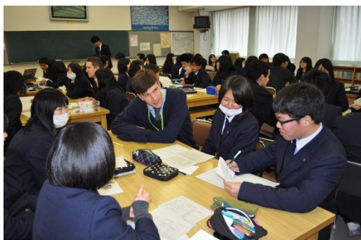
↑カナダ出身の先生と。全員が一度は英語で質問します。

続けて各グループに分かれ、本校生徒が事前に調べた各国のことについて質問し、意見交換を行いました。1 グループにつき生徒5名、講師の先生に 10 分ごとに順番に移動してもらいます。少人数でいろんな先生に触れ合うことが出来たので、生徒也大満足です。