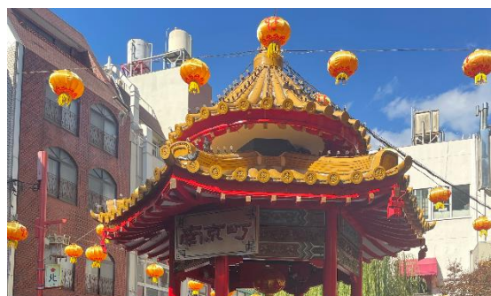
南京町広場はお昼に行った人が多かったかな？

11月2日(水)に行った校外学習について、遅くなりましたが報告です。お天気が良く汗ばむ気温の中、神戸の街中で各班協力しながら「謎解き」を楽しみました。スムーズに進む班もあれば、かなり遠回りをした班もあつたり…4月のオリエンテーション以来の班行動ということで、概ね「楽しかった！」という感想でした。企画・運営をしてくださったN先生に感謝です！