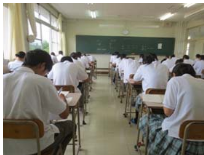
2 学期にまた、この姿で会えますように

最後に、皆さんが病気・怪我することなく、充実した夏休みを過ごし、元気に 2 学期を迎えることを楽しみにしております。