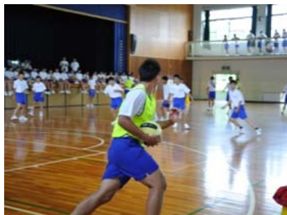
フェアプレイこそ最強

真剣に試合する選手、運営に当たった生徒会役員の皆さんに頼もしさを感じる梅雨の一日でした。