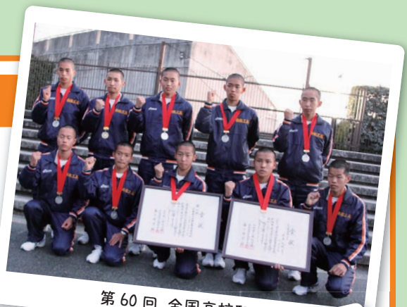
第 60 回 全国高校駅伝

最後になりましたが、いつもたくさんのご支援・ご声援を賜り本当にありがとうございます。皆様の温かいお心遣いのおかげで、全国制覇 8 回という偉業を達成することができたと思います。選手たちは、同窓生の皆様の応援が一番の追い風になるといつも感じております。これからも、少しでも多くの方々に感動を与え、先輩方の偉業に恥じぬような応援され続けるチームを目指し日々努力精進して参りますので、これからも今まで同様にご支援・ご声援を賜りますようお願い致します。