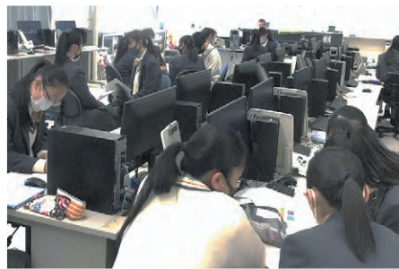
大学教授による外部講師授業