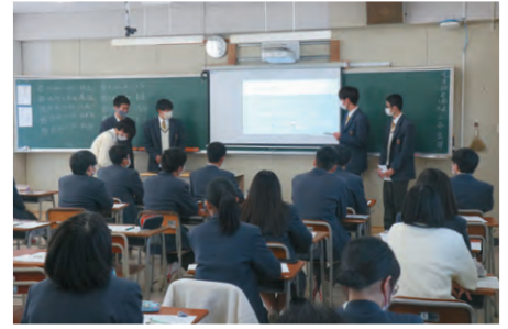
総合的な探究の時間