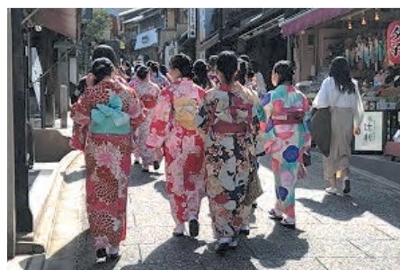
京都研修 ～京都東山・嵐山～