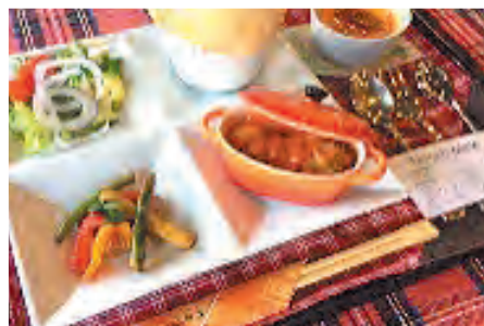
梅吉亭一日シェフ体験 ～「課題研究」食物～