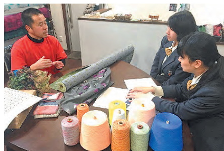
オリジナル播州織の提案 ～Tamaki Niime～