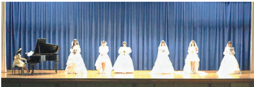
生活情報科 文化祭～播州織ファッションショー