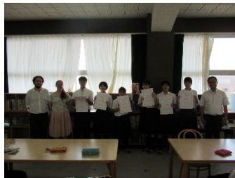
スピーチ・コンテスト