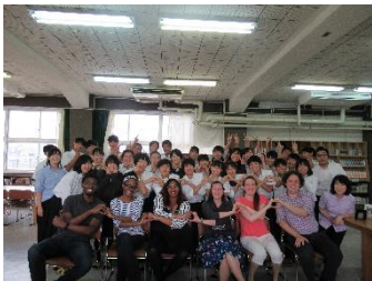
All English Day