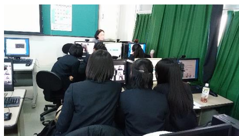
(2グループにわかれて質疑応答)