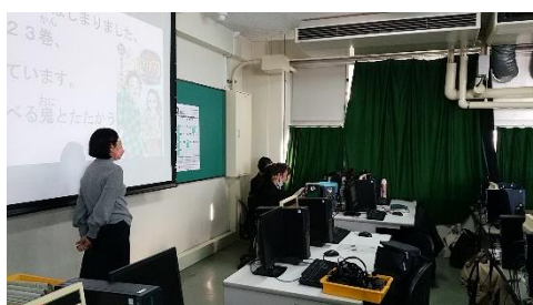
(生徒同士で話しが盛り上がる)