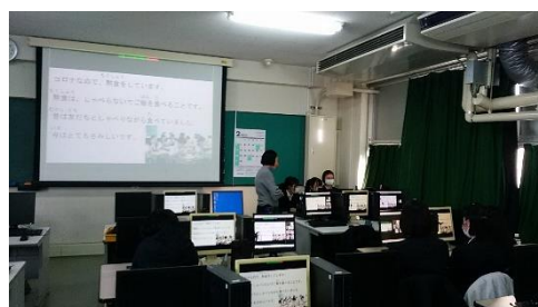
(コロナ禍での学校生活について)