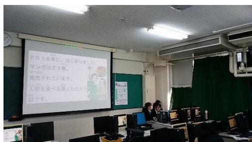
(鬼滅の刃について紹介)