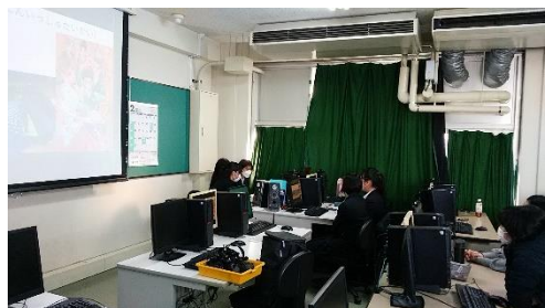
(アニメについて質疑応答)

次にインドネシアの高校からパワーポイント資料を利用して同様の内容について話がありました。使用言語が日本語ですべての会話を行う事ができたので、生徒同士が自由に質疑応答を行い笑い声が絶えない2時間でした。