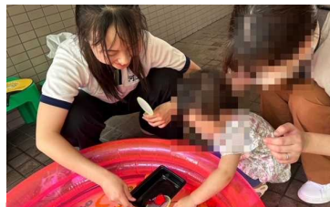
カラカラ夏祭り 7/20(土)

そして、『鳴高やります！プロジェクト』では、夏休み、3カ所まで9名の鳴高生が参加し、活躍してくれました。