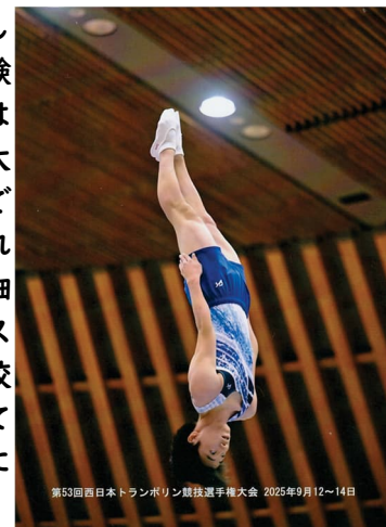
第53回西日本トランポリン競技選手権大会 2025年9月12～14日