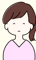
保護者Aさん 1歳児ママ

入学してから娘の成長を日々感じています。親も研修や支援を通して、一緒に学び成長することができています。先生方の温かな指導と、五感を大切にされた保育や季節行事を重んじる学校の方針に感謝の気持ちでいっぱいです。