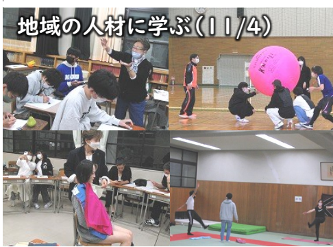
地域の人材に学ぶ(11/4)

←今年のテーマは、「Fight with Individuality ~個性で戦う~」でした。天候に恵まれキッチンカーを楽しむことができました。また、講堂での様々なプログラムでは、それぞれの個性を存分に発揮しました。