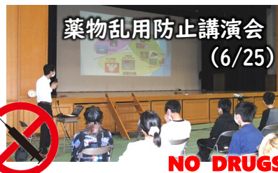
薬物乱用防止講演会(6/25)

5月より全校生徒で取り組んできた「生活体験作文」で、クラスから選抜された6名の代表者が校内生活体験発表会で舞台に立ちました。