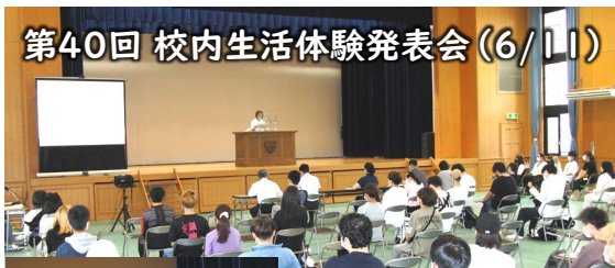
第40回 校内生活体験発表会(6/11)

令和3年度生徒会役員選挙行われ、会長・副会長立候補者および推薦者は立会演説会に臨みました。演説会後には投票を行いました。