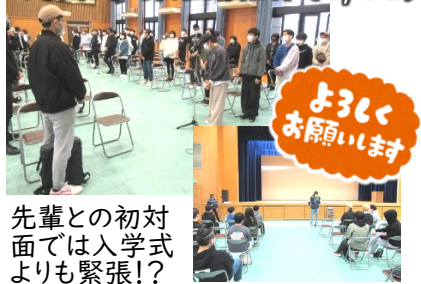
対面式・部活動紹介(4/13)