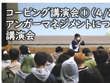
コーピング講演会①(4/23) アンガーマネジメントについての講演会