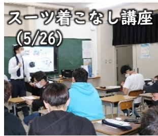
スーツ着こなし講座(5/26)

洋服の青山 神戸駅前本店より講師をお招きして、3年生を対象に「スーツの着こなし講座」を行いました。就職・進学に向けて、スーツの着こなしや選び方、立ち振る舞いなどを学びました。