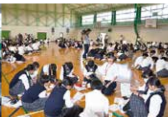
私たちのミライ座談会