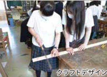
クラフトデザイン