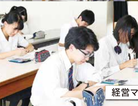
経営マネジメント