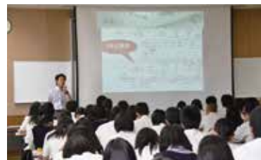
科目選択ガイダンス

三木東高校では生徒一人ひとりが将来を見据えて科目選択を行います。「科目選択ガイダンス」では時間割作成に必要な知識を学びます。自らの時間割を考える過程で、自分の道を切り拓く力を身につけていきます。