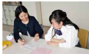
キャリアカウンセラー面談