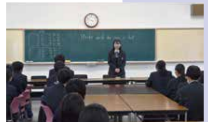
アドバンスクラス生徒対象 合格体験講話

アドバンスクラスは、明確に大学進学希望を持つ生徒のために、2年次から編成しています。もちろん他のクラスからの大学進学も可能ですが、このクラスでは2・3年次でそれぞれ外部講師による進学講話やガイダンス、特別集中講義などのプログラムを用意しています。希望者対象の大学見学会もあります。