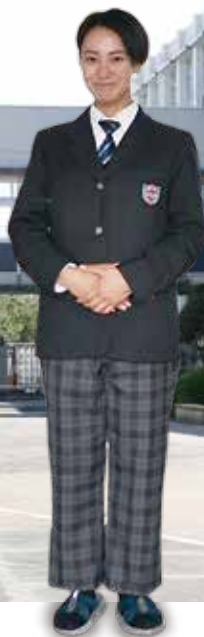
女子 (ネクタイ+スラックス)