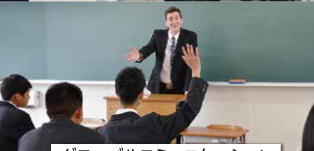
グローバルコミュニケーション