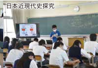
日本近現代史探究