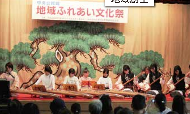
地域ふれあい文化祭

地域の活動に参画した商品開発、地域の課題に取り組むとともに、地域に根付く文化や歴史を学ぶ。