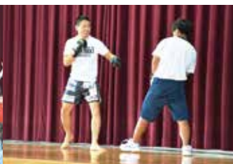
私たちのミライ講演会