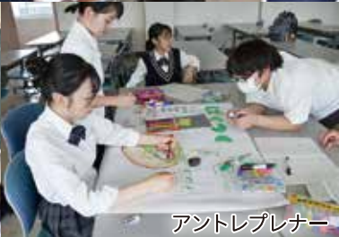
アントレプレナー