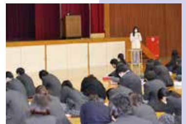
卒業生による進路講話