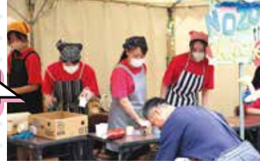
ポテト、ナゲット、ジュース