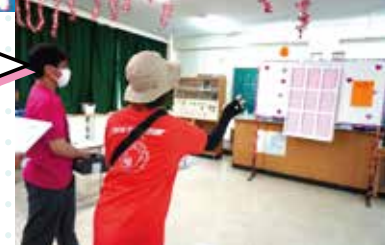
ユニバの牛乳瓶ストラックアウト