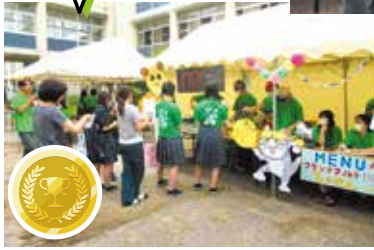
たません、フランクフルト