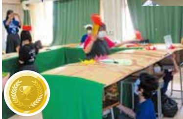
人間モグラたたき