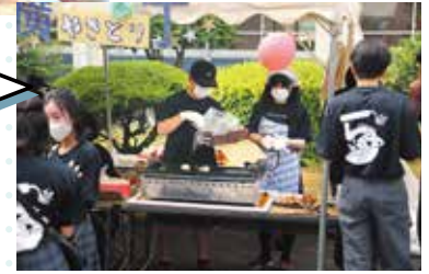
パンケーキ、焼き鳥