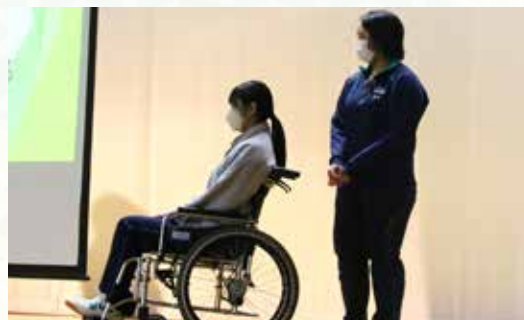
健康福祉科目群介護実習