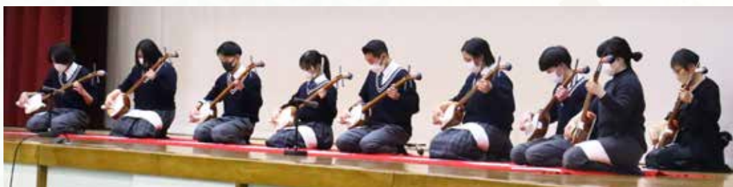
オープニング 「邦楽」

つい先日には、本校に県下の総合学科高校15校が集い、1年間の集大成である研究発表会が行われました。その様子は新聞にも大きく採り上げられ、ホスト校として大会運営に携わり、見事成功に導いた多くの生徒たち（キャリアアスタッフ）の励みにもなりました。こうした様々な体験を経て、変化の激しい時代をしなやかに生き抜く力の獲得をめざし、これからも三木東高校は、キャリア教育を核とした教育活動を進めて参ります。引き続き温かいご支援を賜りますようお願い申し上げます。