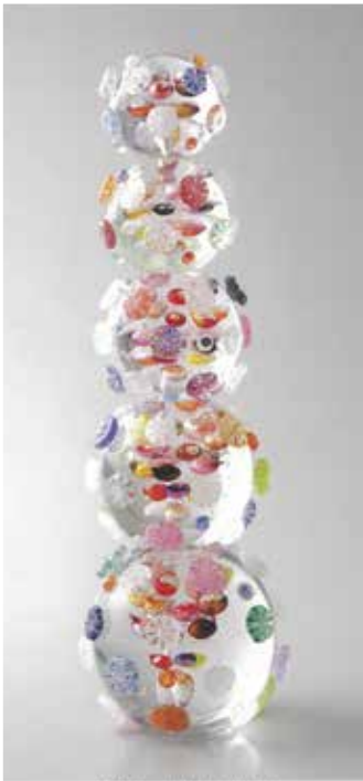
藍色×ブルー（球16.6×高さ55.8cm）

1972年兵庫県生まれ。93年富山ガラス造形研究所造形科卒業。94年研究科修了。94-97年富山ガラス工房勤務。97年に富山ガラス個人工房群にTaizo Glass Studioを設立。2005年に富山市東岩瀬の森家土蔵群の一角を改修し移転。精緻なレース文様が紡ぎ出す潇洒なうつつ、幾重にもなるガラスの層が織りなす色彩のコントラスト、ガラス装飾を閉じ込めた艶やかな小宇宙…、展開する繊細なガラスの世界は、そのひたむきさと、緻密に重ねられた工程に裏付けされる。「食」の世界からの求めも多く、高級料理店からうつわの依頼も絶えない。富山ガラス造形研究所第1期生。