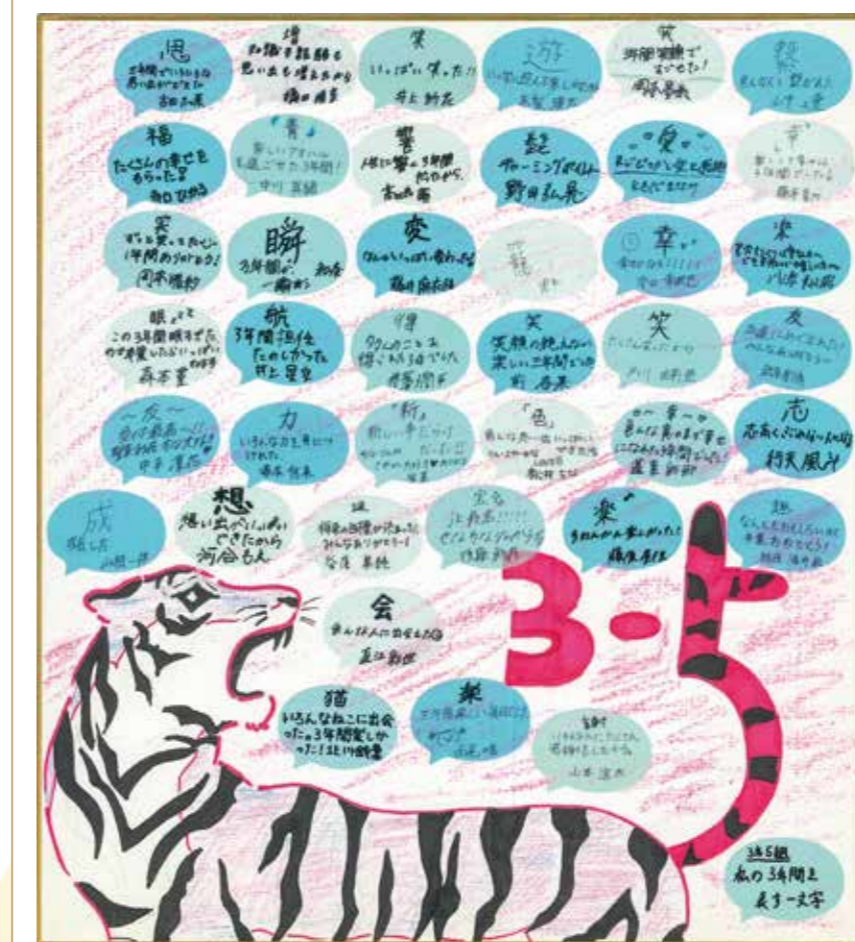
5組担任 酒井 航