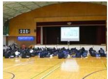
学校説明会 一日目

このオープンハイスクールを通して、三木東高校が中学生の皆さんの進路希望校になってくれれば嬉しい限りです。たくさんのご参加、ありがとうございました。