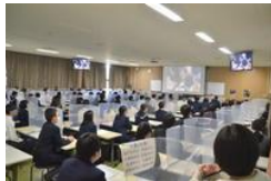
学校説明会 二日目