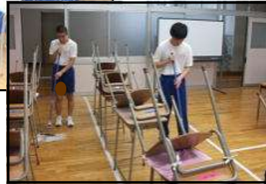
▶ 日常生活の指導 (そうじ)