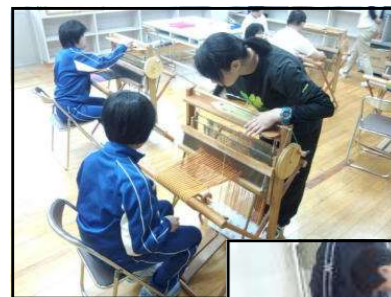
◀ 作業学習 (さわり)