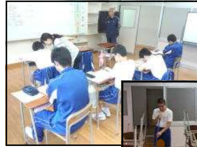
◀ 教科学習 (数学)