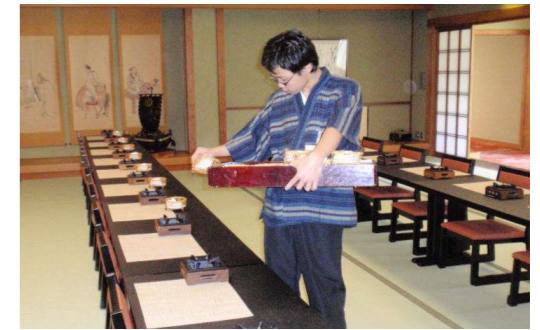
【現場実習】株式会社井筒屋 宴席準備