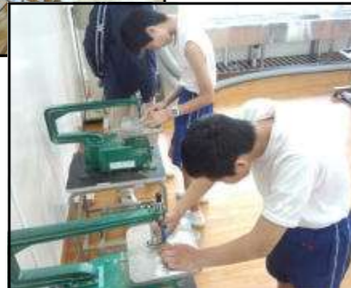
▶ 作業学習 (木工)