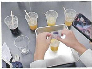
●兵庫医科大学 実験