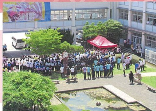
●文化祭 中庭ステージ

普通科は、2年生から文類型と理類型に分かれます。 文類型の生徒は、大学の文学部、経済学部、商学部、法学部、国際学部、教育学部などへの進学を希望しています。国語、社会、英語の授業時間数が多くなっています。 また、総合的な探究の時間では、教科・科目の枠にとらわれず、自らの設定した課題を解決する力を養います。