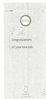
発音レッスン・採点画面