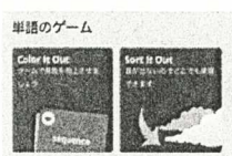
学習メニュー画面