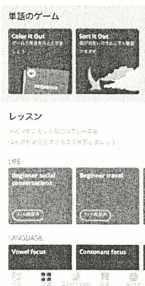
学習メニュー画面