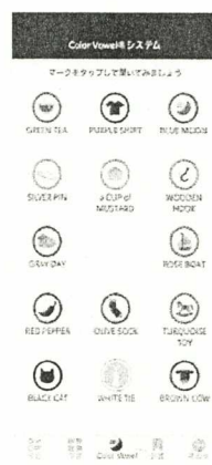
独自の学習システム