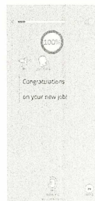
発音レッスン・採点画面