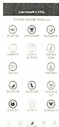
独自の学習システム