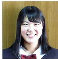
兵庫大学 看護学部 看護学科