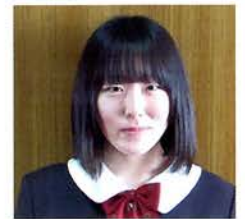
株式会社エディオン

私にとって香寺高校は、自分が本当にやりたいことは何か教えてくれた場所だと思っています。中学生のとき、特に行きたい高校がなかった私に先生が勧めてくれたのが総合学科である香寺高校でした。1年次では、人前でスピーチする機会が多くありました。人見知りな私でもスピーチを重ねることで相手に一番伝えたいことを堂々と言える強い心が持てました。また、部活動では、仲間との協調性を大切に、賞をいただいたことで大きなやりがいを感じました。2年次からは多くの選択科目の授業を受けました。私が多く選択した情報ビジネスの科目群では、検定取得を目標に勉強に励みました。また、3年次からは進路選択をしました。検定取得や進路実現のためには多くの先生と友人の助けが不可欠でした。授業でのペア学習や放課後、休日の自主学習もしっかりしており、自分が成長できる環境に恵まれたことに感謝しています。将来、香寺高校で過ごした3年間はきっと役に立つと思います。