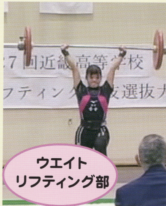
ウエイト リフティング部