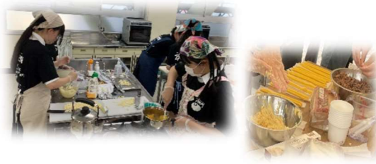
2-4 チュロス DODOMAN