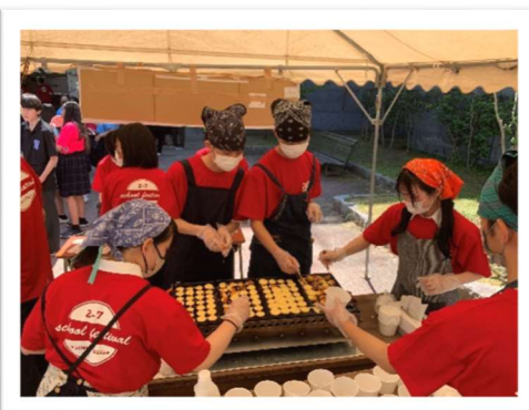
2-7 ベビーカステラ 卵糖

皆さん、文化祭おつかれさまでした。ノウハウがない状態でお店を運営するのは難しかったと思います。けど、皆さんが積極的に協力してくれたおかげで文化祭を乗り切れました。これからも行事はあると思うので、今回のように皆で楽しんでいきましょう！