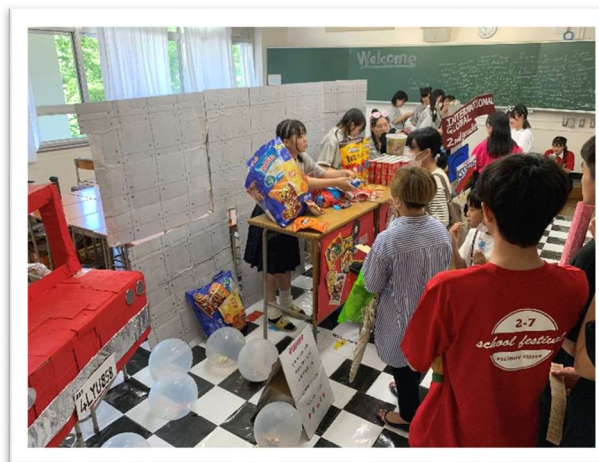
2-1 American Café DADADA!