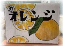
2-5 駄菓子屋 さこちゃん

おつかれ様でした。当日、ばたばたして余裕がなく申し訳ないです。各々の仕事をやりきってくれてありがとうございます。始めはなかなかチュロスができず大変だったけれど、途中からは生地を作るスピードが上がって最終的には売りきれて良かったです。