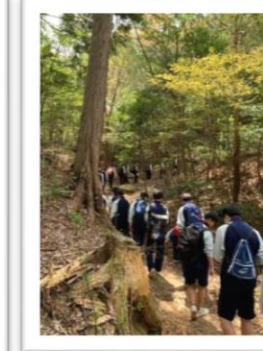
4月22日 校外学習 in 奈良