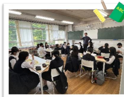
コース ECC 土曜英会話