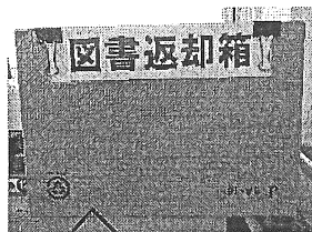
「図書返却箱」 職員室入り口右手 にある