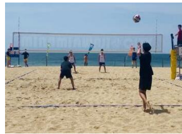
▲県大会(ビーチバレー)