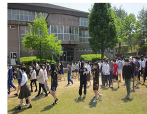
5月 寮防災避難訓練より