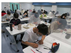
アフタースクールゼミより